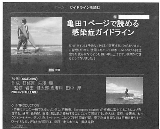
図2. ガイドラインを読む