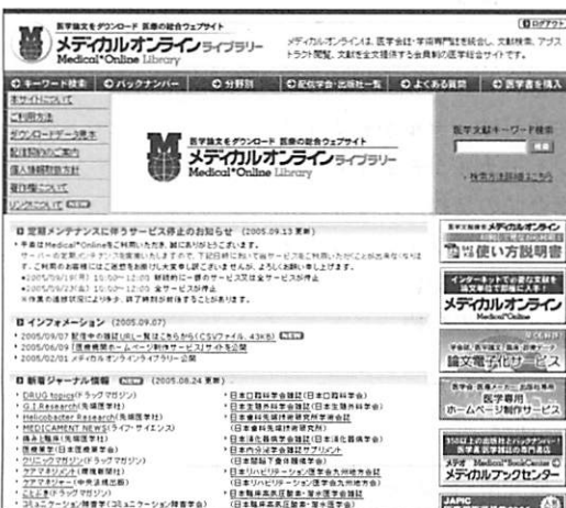
図1. メディカルオンラインライブラリー トップページ http://www.meteo-intergate.com/library